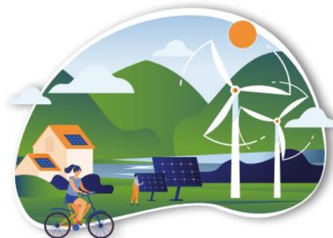
CLEAN ENERGY TRANSITION