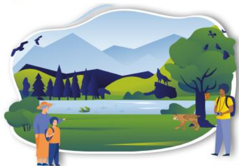
NATURE AND BIODIVERSITY