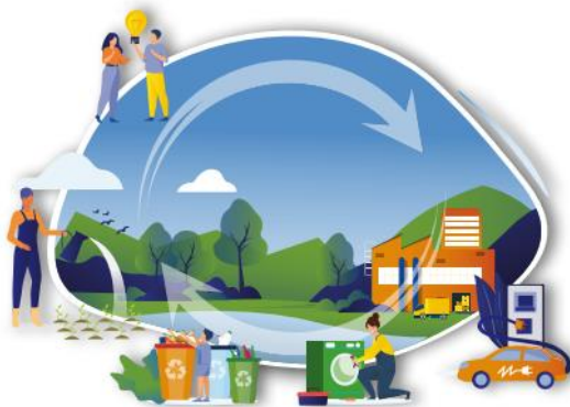
CIRCULAR ECONOMY AND QUALITY OF LIFE