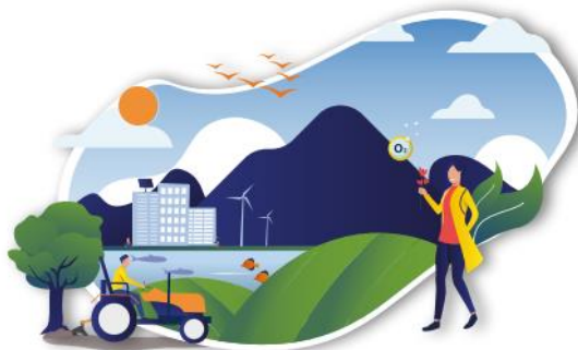
CLIMATE CHANGE MITIGATION AND ADAPTATION